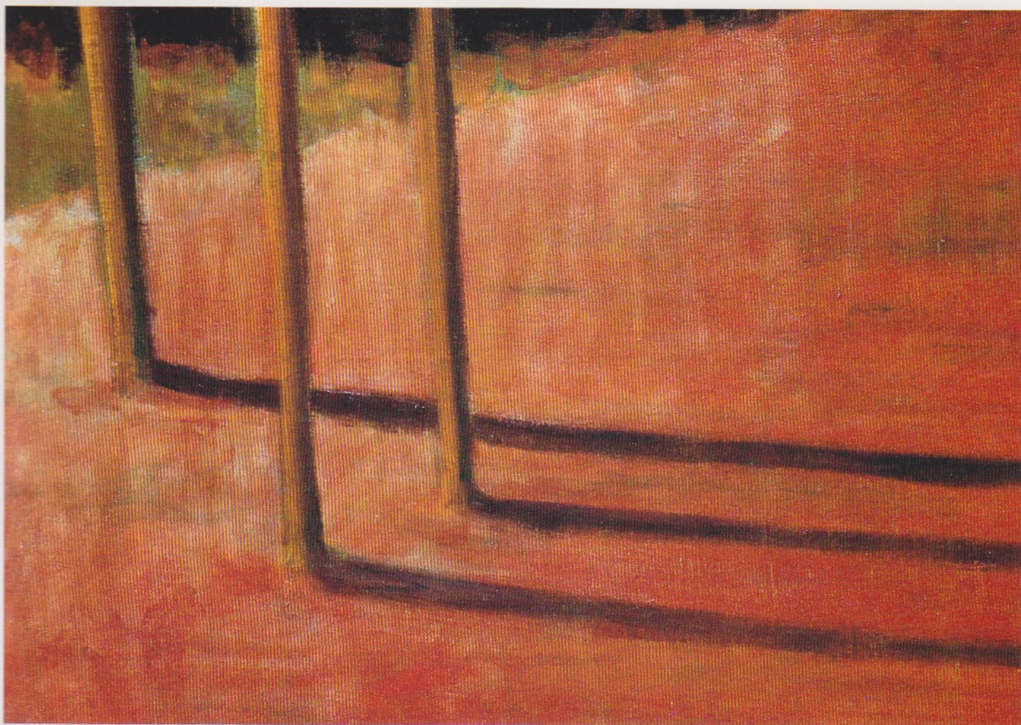
Sin título. Acrílico sobre tela. 117 x 127 cm.